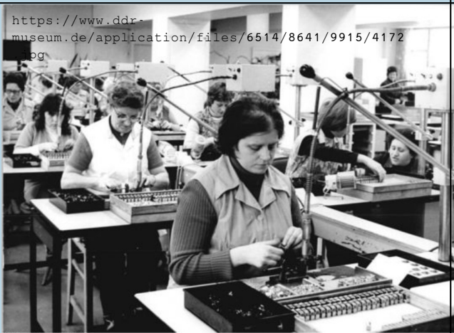
17. Januar 1979

https://www.ddr-museum.de/application/files/6514/8641/9915/4172.jpg